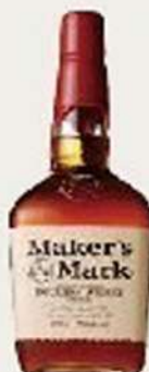
メーカーズマーク Makersmark