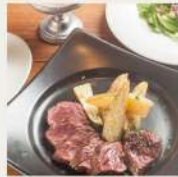
オーダーカットステーキランチ