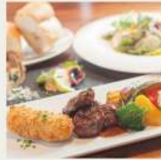
スペシャルランチ