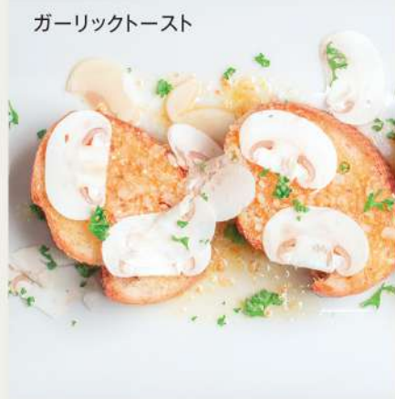
ガーリックトースト