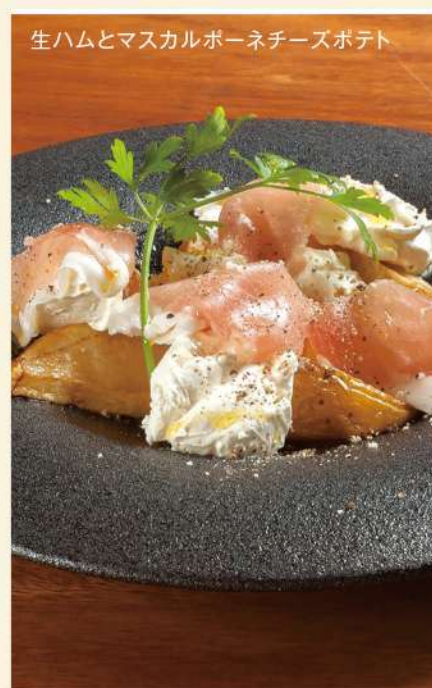
生ハムとマスカルポーネチーズポテト