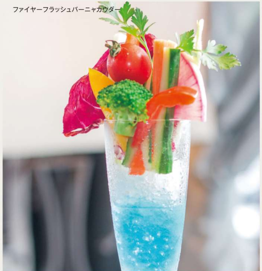
ファイヤーフラッシュバーニャカウダー