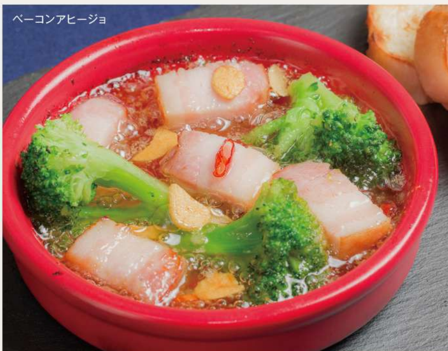
ベーコンアヒージョ

CREW'S CAFEの 鶏唐揚げ Deep-fried chicken of CREW'S CAFE 750 yen