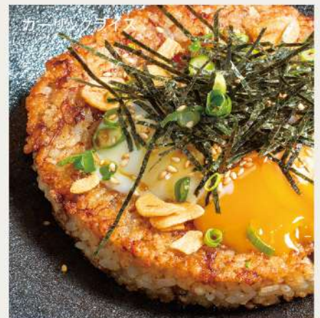
ガーリックライス