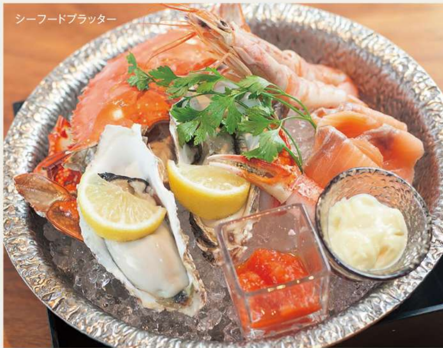
シーフードプラッター